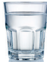
water for the milk