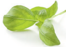
fresh basil leaves