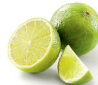
lemons or limes