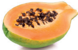
papaya / banana