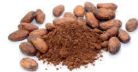
pure cacao powder