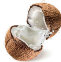
unsweetened coconut milk