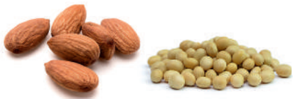
almonds / soy beans (dry)