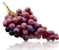
bunch of red grapes